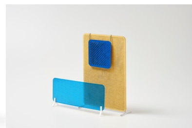
左《空山遠潤》枯山水を感じるインテリアオブジェ /中《HOMiE》心地よいプライベート空間をつくる ASMR スピーカー 右《TOU》透毛具合を調整出来る卓上パーティション