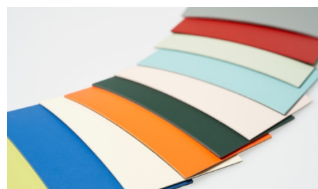
フォルボ社のファニチャーリノリウム

160年前にヨーロッパで開発されたリノリウムは、抗菌性、抗ウイルス性があることから病院や学校などで床材として多く使用されてきた歴史のある素材です。一見するとそのテクスチャーは化学製品のようにもみえますが、実際には亜麻仁油を主原料に松脂、木粉などすべて天然の材料から製造されており、植物由来の抗菌性、抗ウイルス性に加えて、廃棄時には土に還る生物分解性も備えています。今回使用したフォルボ社のファニチャーリノリウムは生産工程においても安全でクリー