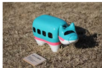
「アール・ペコ」 はやべこ 807号 —太田 萌子

本展では受賞作品の中から附属美術館で選抜したデザインや絵画、彫刻にいたる様々な分野の作品を一堂にご覧になれます。出展作品を通して、若い表現者たちの制作に対する真摯な姿勢や弛まぬ努力、そして本学の教育課程で培った確かな造形力を感じていただければ幸いです。